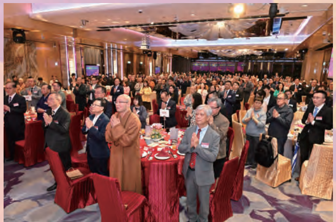
▲全場嘉賓同唱《佛寶歌》