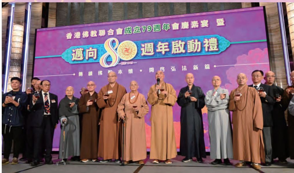
◀會長寬運法師與各董事同仁一起向出席的諸山大德、嘉賓友好祝茶，祝願香港經濟繁榮安定，自在吉祥。