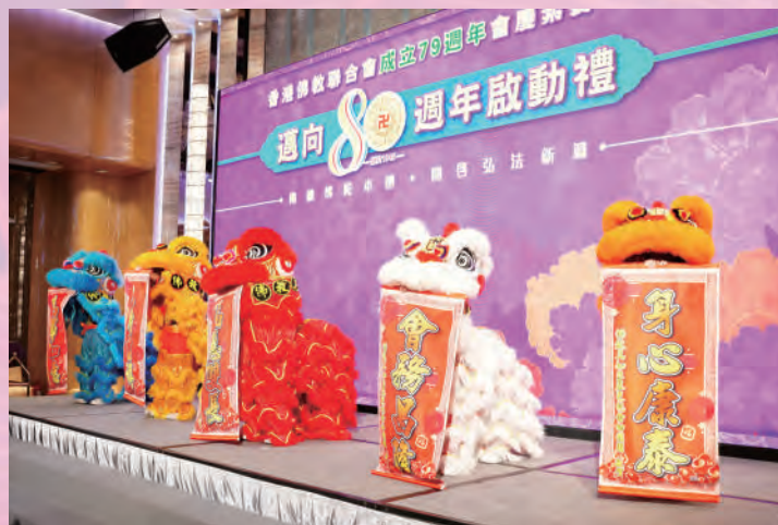
▲佛教真如李琴芝紀念幼稚園龍獅隊的「五隻小獅」，分別代表佛教旗的藍、黃、紅、白、橙五色，呈現佛教慈悲、和平精神及吉祥智慧。

踏入80週年，本會除舉辦清明法會；佛誕浴佛大典、皈依大典、法會；6·15健康素食日；統籌書展佛教坊等恆常年度活動外，由2025年5月起至12月將舉辦近十場與身心靈相關的佛學講座及多場不同類型的演出，包括邀請會屬學校學生在紅磡香港體育館作演藝展能表演、邀請內地藝術團體來港作佛教藝術相關的綜藝表演。有關活動詳情，請密切留意本會最新動向。☎