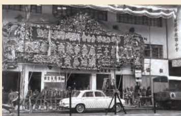
▲1967年1月22日，本會自置新會所開幕（即現時灣仔駱克道338號會址）。

佛聯會成立80週年了，實實在在說，今天我們承受的是果實。先賢大德創建的事業得來不易啊！我們要好好守護，還要加以發展。