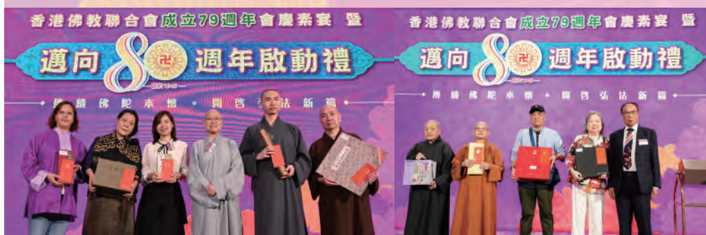
▲晚宴設抽獎環節，與眾同樂。